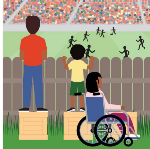
Equality | Everyone gets the same support, this works better for some than for others.