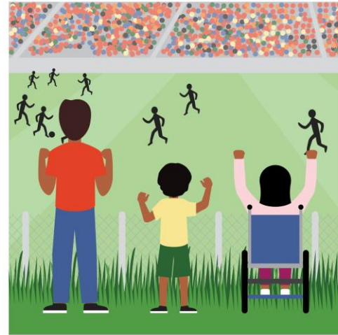
Justice | The structural and systemic cause of inequality is addressed. Everyone can come as they are.